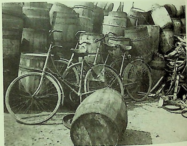
Fustagerne, der brugtes til forsendelse af muslingerne.