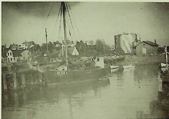
Strib Havn med DDPa's store tank. Huset foran er det eneste bevarede fra færgoverfarten.

I august 1942, kort før muslingesæsonens start, meddelte Fiskeridirektoratet, at det ifølge fiskeriloven var forbudt at fiske muslinger med trawl. Det var en streg i regningen for såvel "Mytilius" som de mange fiskere. På lavt vand var der stort set ingen muslinger tilbage, og man havde derfor regnet med, at tage muslinger på større dybde, hvilket krævede trawl. Man måtte nu påregne at skulle hente muslinger langvejs fra, men her lå man i skarp konkurrence med landets mange andre muslingekogier. For at sikre sig transportmulighed købte man straks herefter stenfiskerfartøjet "Marie" af Odense for 1.800 kr.