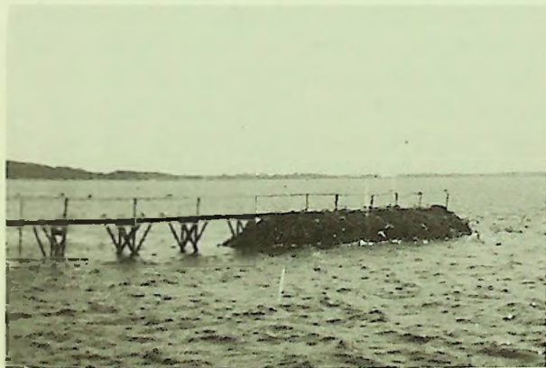
Skaldyngerne rager op over vandet.

I november måtte "Mytilius" indlede forhandlinger med fiskerne på de ca. 40 både i Horsens Fjord om mindsteprisen for muslinger. Prisen havde hidtil ligget mellem 40 og 70 kr. pr. ton, alt efter kvalitet; men nu forlangte fiskerne en mindstepris på 50 kr. Før der gik hausse i muslingerne, havde de kostet et par kr. pr. ton.