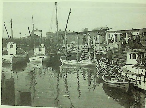
Strib Havn ud for kogeriet.

I marts 1942 fandt et sandt muslingeeventyr sted i Stribbugten. Omkring 40 fiskere fra Strib, Middelfart, Skærbæk og Kolding skræbete muslinger ud for Strib havn og Rubæksbanke, men også ved Fænø. Muslingerne blev taget på to-fire meter vand og derpå sejlet til enten Strib eller Middelfart, hvorfra de pr. bil blev fragtet til Kolding og derfra eksporteret til Tyskland. På gode dage blev der i Strib landet en snes tons, hvilket gav fiskerne en god for tjeneste, da prisen lå på ca. 50 kr. pr ton. Man forudså dog allerede, at bestanden næppe kunne holde til så stort et fiskeri.